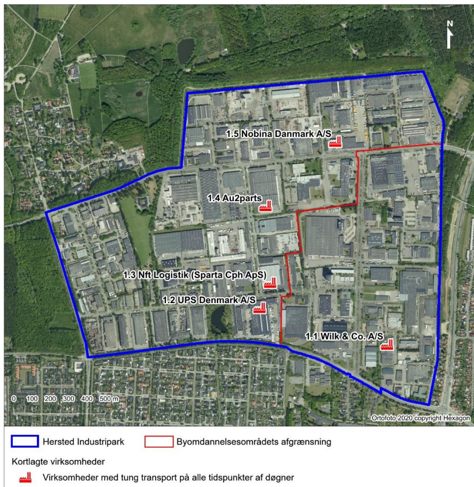
Figur 3-2 Kortlagte virksomheder med tung transport på alle tidspunkter af døgnet

De kortlagte virksomheder fremgår af Figur 3-2 nedenfor og gennemgås herefter enkeltvist.