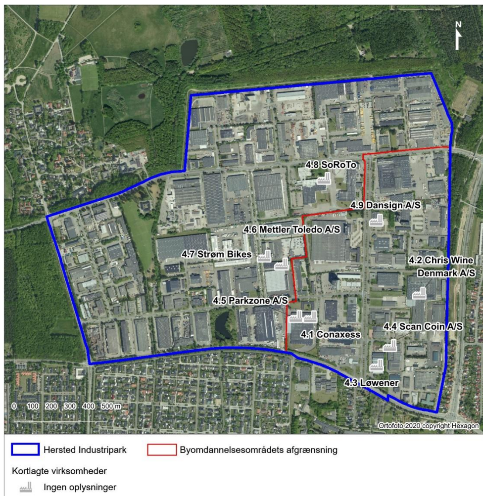
Figur 3-5 Kortlagte virksomheder uden oplysninger om støjende aktiviteter