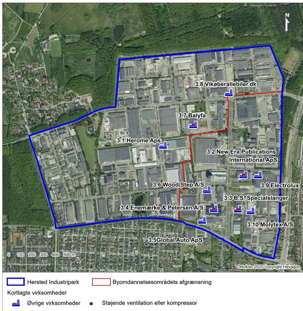
Figur 3-4 Øvrige kortlagte virksomheder