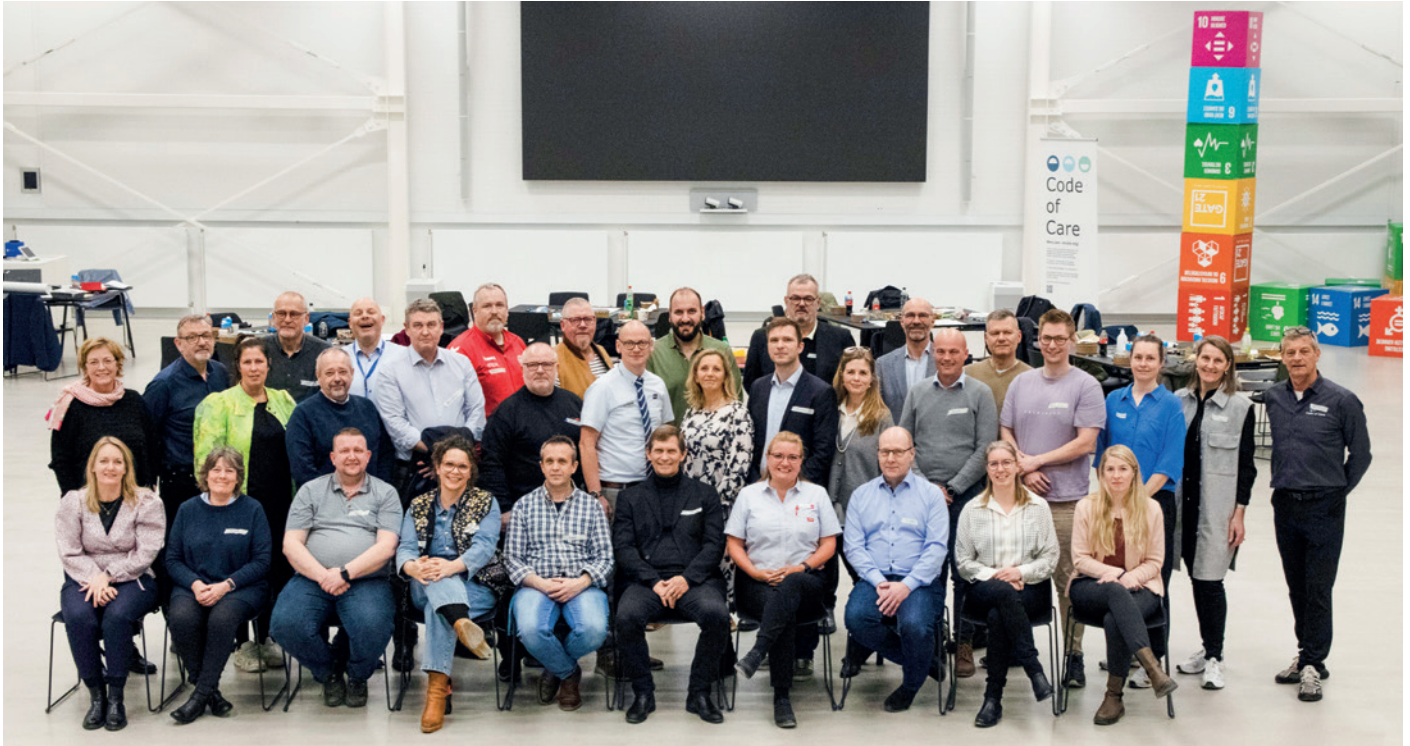
Den nyetablerede Code of Care taskforce i Albertslund, som lige nu består af 42 virksomhedsledere.

”Meningen med Code of Care taskforcen er at skabe småjobs under 20 timer til de borgere i Albertslund, som har andre udfordringer i livet end blot ledighed, og iværksætte tiltag, der fremmer øget inklusion på arbejdsmarkedet.”