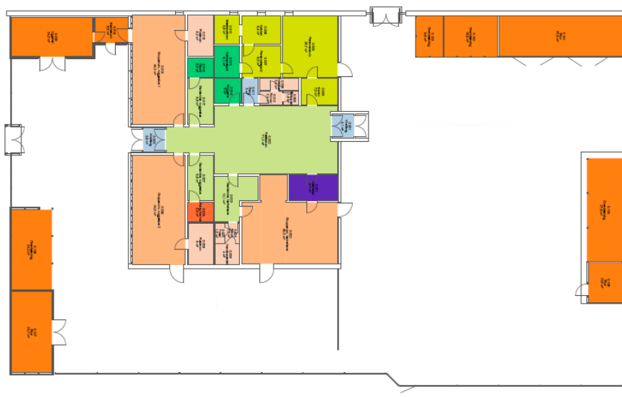
Figur 2. Oversigt over bygningerne. De orange områder er udhuse, og bygningen med mange farve er hovedbygningen.