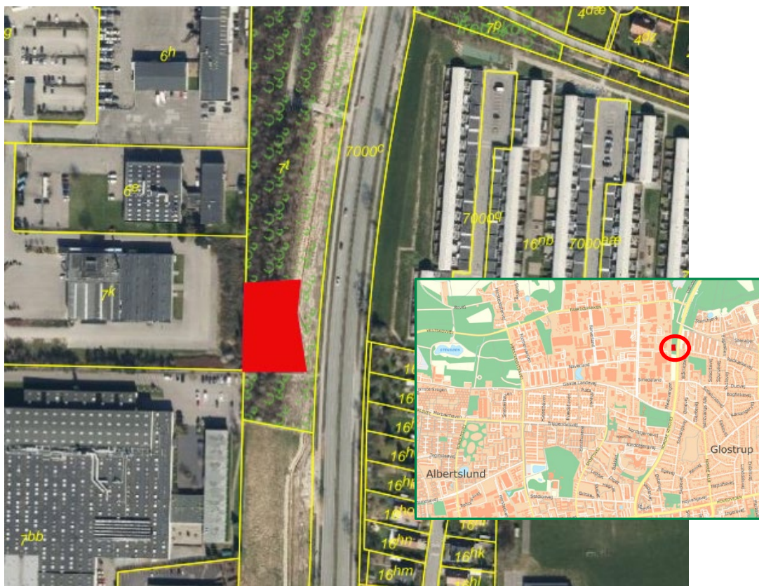
Figur 1. Omtrentlig angivelse af arealet på matr.nr. 7t Hvessinge By, Glostrup. Ortofoto fra 2020.

Miljøstyrelsen tillader hermed, at fredskovspligten ophæves på en del af matr. nr. 7t Hvessinge By, Glostrup, som ligger i Glostrup Kommune, med henblik på anvendelse af arealet til stationsforplads i forbindelse med letbanen. Der sker ophævelse af fredskovspligt på ca. 0,19 ha. Se nedenstående kort.