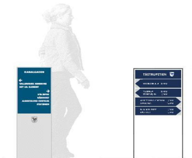
Fig 3. Størrelsesforhold mellem eksisterende og nye skilte