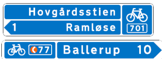
Fig 1. Eksemplet viser stinavne og rutevejvisning efter de gældende vejregler.

Det ville betyde, at alle skilte bliver udformet med hvid skrift på blå bund, som vist her: