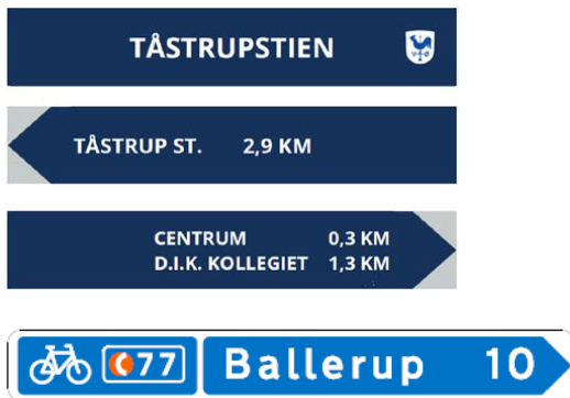
Fig 2. Eksempel nyt skilt med stinavn og lokal vejvisning i nyt Albertslund design, der nogle steder vil skulle opstilles sammen med ruteskiltningen, der foreslås bibeholdt i vejregeldesign.

Det nye Albertslund design; store bogstaver på oceanblå baggrund indeholder stinavne og vejvisning til lokale mål. Designet afviger tilstrækkeligt meget fra vejreglernes design, så der ikke er tvivl om, at der er tale om en helt anden type vejvisning.