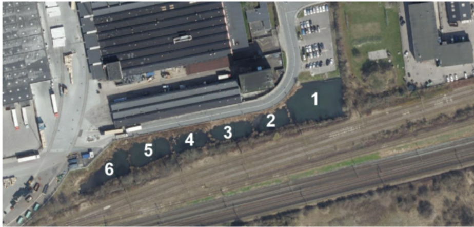
Figur 1: Bassin K set fra luften. Det er udelukkende delbassin 1 og 2 der planlægges oprenset i dette projekt.

Af ansøgningen fremgår, at de to første sektioner indeholder så meget sediment, at vandrensningseffekten er nedsat. Ansøgningen er vedlagt analyseresultater af sedimentprøver, som viser høje værdier for indhold af olie og flere tungmetaller.