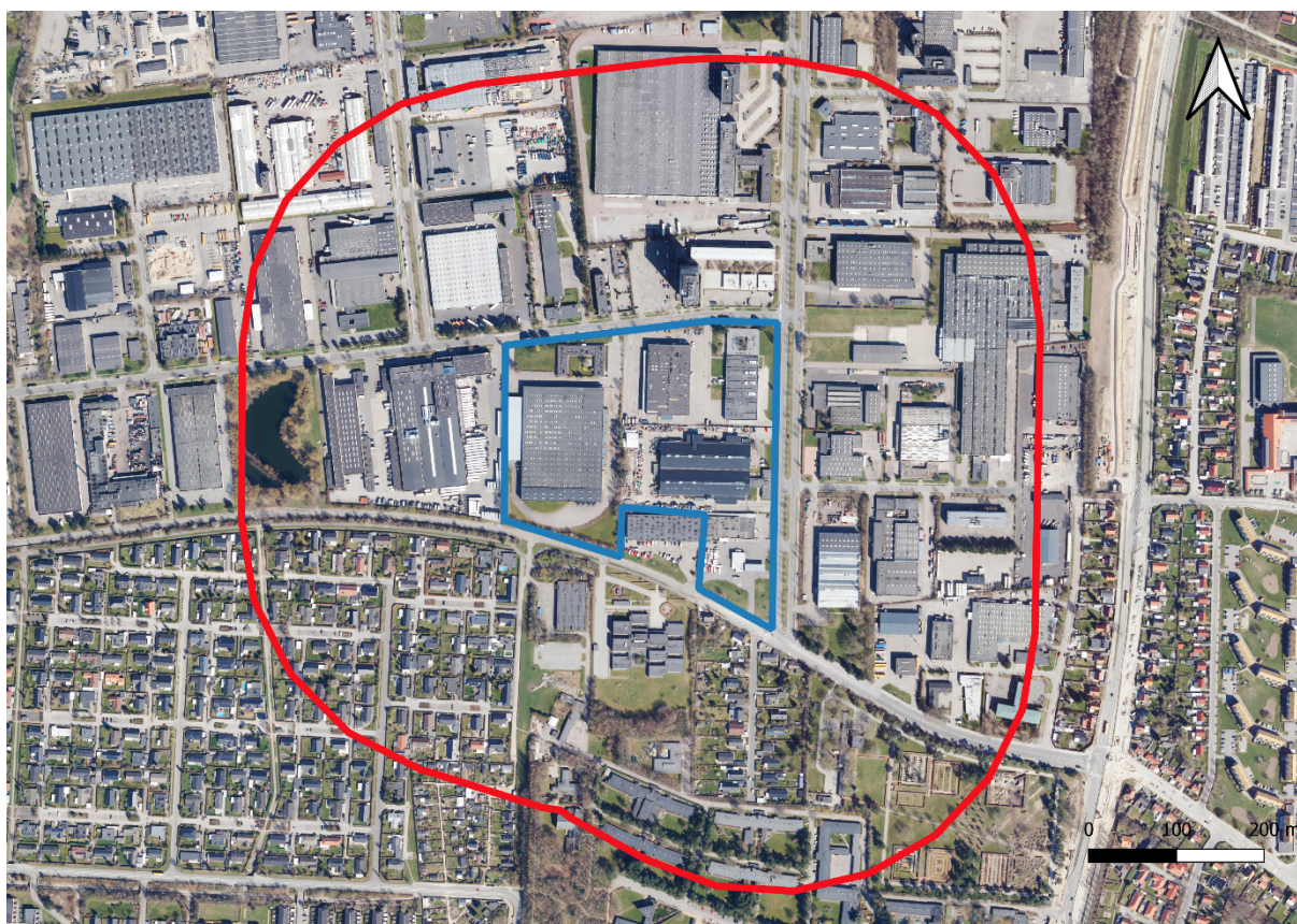
Figur 2 viser en radius omkring ca. 300 m fra projektområdet. Virksomheder i område er udvalgt til at undersøge om mulig lugt- og luftforurening i projektområdet.

Vurderingen af miljøpåvirkninger er baseret på hvilke virksomheder, der befinder sig i nærområdet af boligbyggeriet, og som har udledning af lugt- og/eller luftforurenende stoffer. Virksomhederne, som bliver gennemgået i nærværende notat, ligger alle inden for en radius af ca. 300 m fra projektområdet og fremgår af figur 2. Indledningsvis er der foretaget en kortlægning af alle registrerede virksomheder på adresserne i nærheden af Hersted Village. Ud fra bl.a. branchekoden udvælges de virksomheder, som skal indgå i en indledende screening.