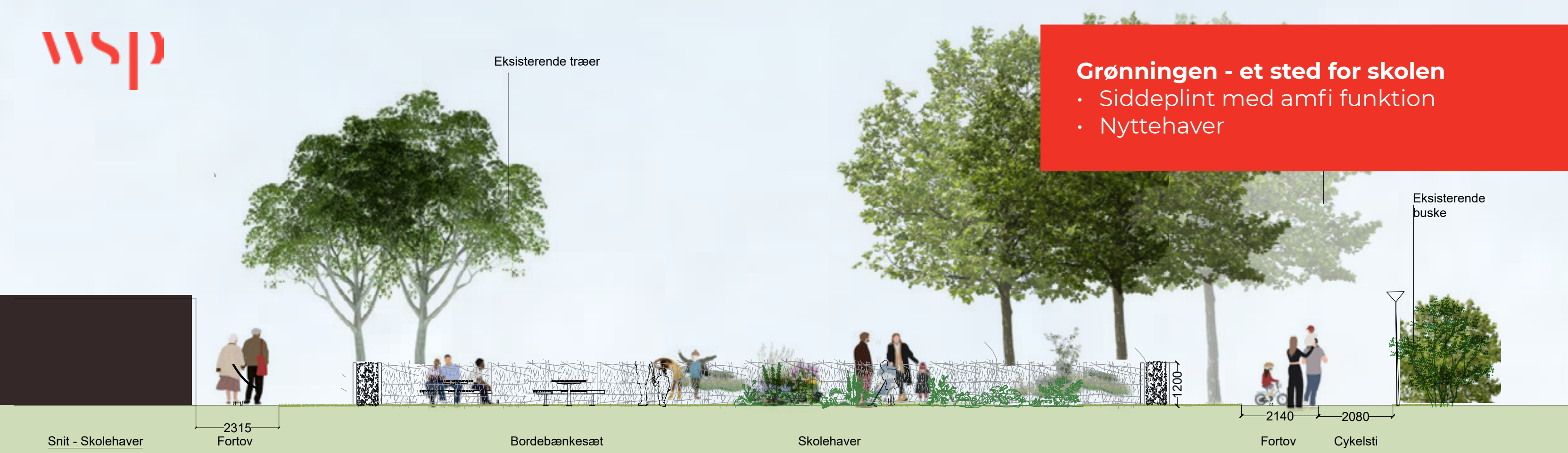
Snit - Skolehaver