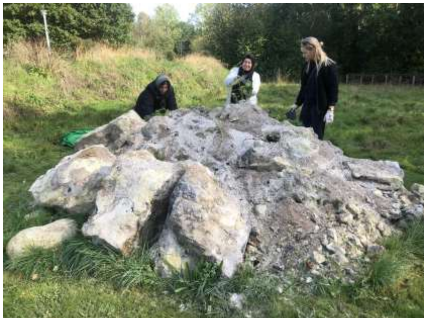
Kalkhøjen i Biotopia

Vi vil tilbyde skolerne undervisning, lave guidede ture, arrangere arbejdsdage, åbent hus, formidling mm. Pleje 10 % mailnetværket. Bakke op om borgernes, boligområdernes og boligselskabernes arbejde for mere natur og flere naturoplevelser i byen. Understøtte kommunens Naturplan og "Grøn kommune".