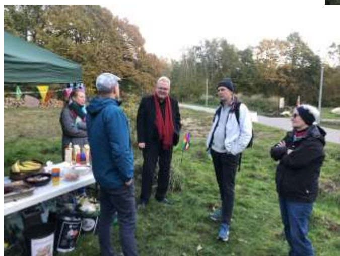
... og skabt overblik