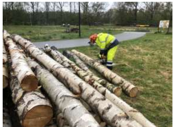
Opskæring af stammer til brændemur og siddepladser

Biotopia og Bjørneklo. Den første onsdag i måneden i sommerhalvåret hjælper KØF med at skabe biodiversitet i Biotopia. Foreningen banede vej gennem beplantningen for Oplevelsesstien og vedligeholder den. De plejer blomsterbedet, klipper stierne, fjerner affald, dyrker kompostorm og har skåret stammer op til brændemuren og på rigtig vikingemaneér flækket andre, der blev brugt til stolper og bænke. I alt en uvurderlig hjælp til at vedligeholde Biotopia. I 18 år har KØF bekæmpet bjørneklo – naturligvis uden gift! I mellemtiden er også andre invasive arter dukket op, som f.eks. vild pastinak. Foreningen har besluttet at bekæmpe planten i Birkelundparken, og håber at andre vil adoptere andre områder.