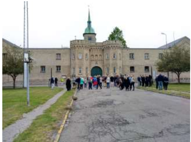
Rundvisning i Fængslet