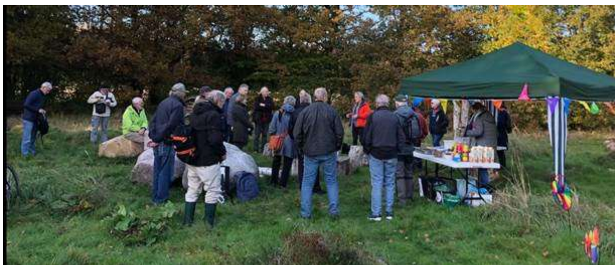
Vores 25 Års jubilæum blev holdt i det fri i Biotopia