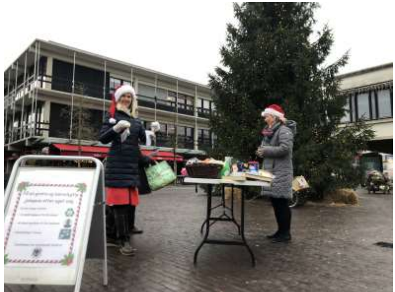
Uddeling af perlatorer

Blødt vand. I 2021 fik vi endelig taget hul på blødere vand i Albertslund, da det ene af de 3 af HOFORs regionale vandværker, der forsyner Albertslund, fik installeret blødgøringsanlæg. Dermed fik den nordlige del af kommunen blødere vand. I løbet af de næste 2-3 år, når de andre vandværker kommer med, vil vandet blive endnu blødere og resten af byen vil også komme med. Det er et stort skridt, der betyder mindre elforbrug, mindre slid på apparater og mindre behov for rengøringsmidler. På alle måder godt - hvis altså borgerne så rent faktisk også ændrer vaner og bruger mindre sæbe og rengøringsmidler. Det har vi brugt vores platforme og AP til at informere om og besvare spørgsmål om fra borgere, boligområder og i fht. fællesvaskerier.