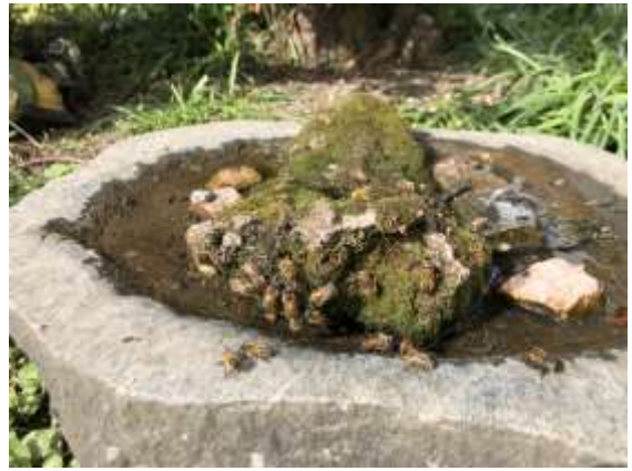
Bi-have i Vest

33 gik med på turen i Egelundparken, hvor kommunen har tyndet kraftigt ud i træerne af hensyn til biodiversiteten. Derfor var det et godt sted at se på og diskutere forholdet mellem træer og biodiversitet.