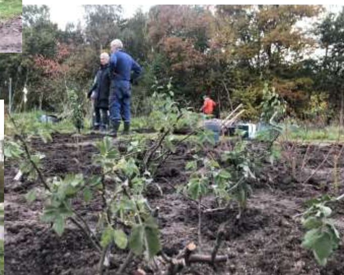
... og der blev tid til en god snak