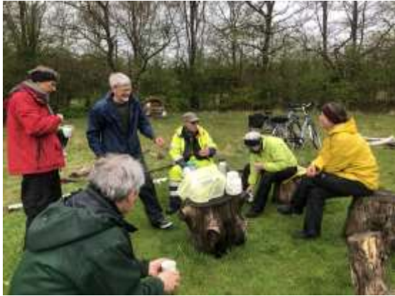
KØF i Biotopia