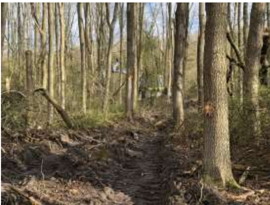
Bliver skoven ødelagt eller rigere på natur?

Store Vejleå Trampesti og ture. KØF vedligeholder og rydder "sløjfen" i den gamle skov ved golfbanen, men har ikke haft ture i perioden. Til gengæld inviterede KØF på en gåtur i Egelundparke n hvor den hårdhændede udtynding rejste spørgsmålet: Blicher skoven ødelagt eller rigere på natur? Andre ture var "Oplev Oplevelsesstien", "Klimasikring i Vallensbæk og Letbanen", samt klimasikringen Haraldsminde i Ballerup.