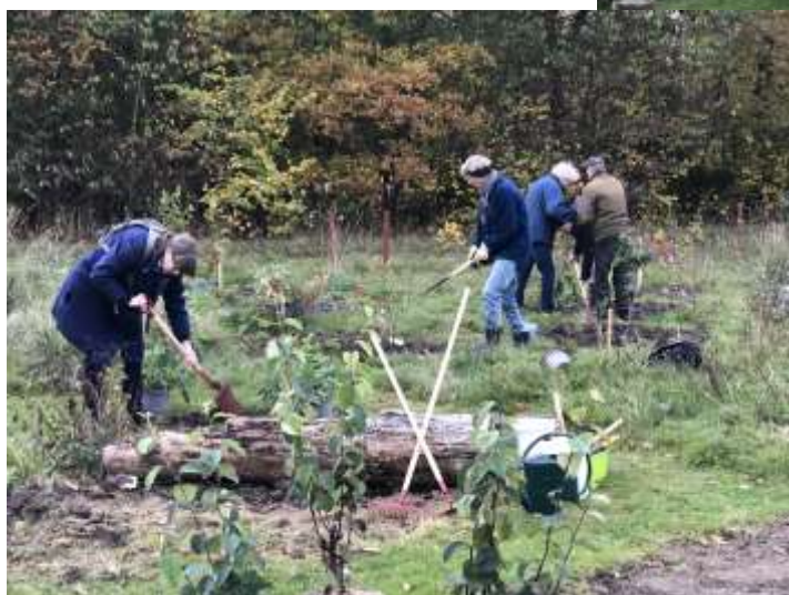
... og der blev plantet