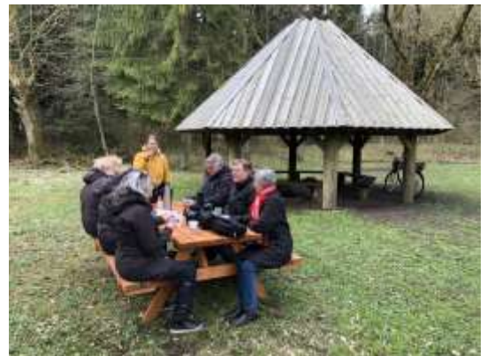
Seniorklub på guidet tur