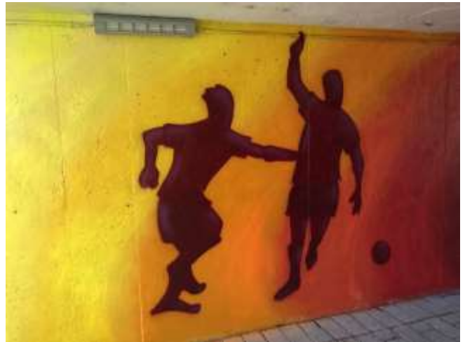
Udsnit af udsmykningen med temaet Frivillighed, Forening, Fællesskab og Fodbold i tunnelen ved BS 72

For sjette gang udgav KØF årets "Bydiversitets plakat" med eksempler på udsmykninger i byen skabt inden for det seneste år.