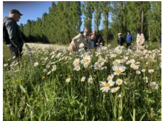
På tur til biodiversitet

Endvidere hjalp vi med opreklamering af Natur & Ungdoms og Danmarks Naturfredningsforenings ”Vild mad i Vestskoven”, bibliotekets ”Den vilde have” og Naturgruppens borgermøde forud for kommunevalget om ”Naturen i Albertslund”.