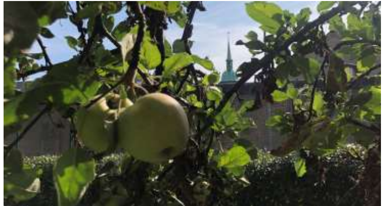
Fængslet – hvor kultur og natur smelter sammen

Vridsløselille Fængsels Venner. I respekt for fængslets kulturhistoriske betydning og muligheden for at skabe en gammel bypark er KØF gået sammen med andre gode kræfter i foreningen ”Vridsløselille Fængsels Venner”. Opgaven er at finde balancen mellem nybyggeri på området og bevarelsen af kulturhistorien og naturen.