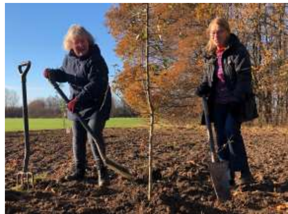
Alle planter træer

Træregnskab Ultimo 2021 har vi registreret 3.821 træer (og buske).