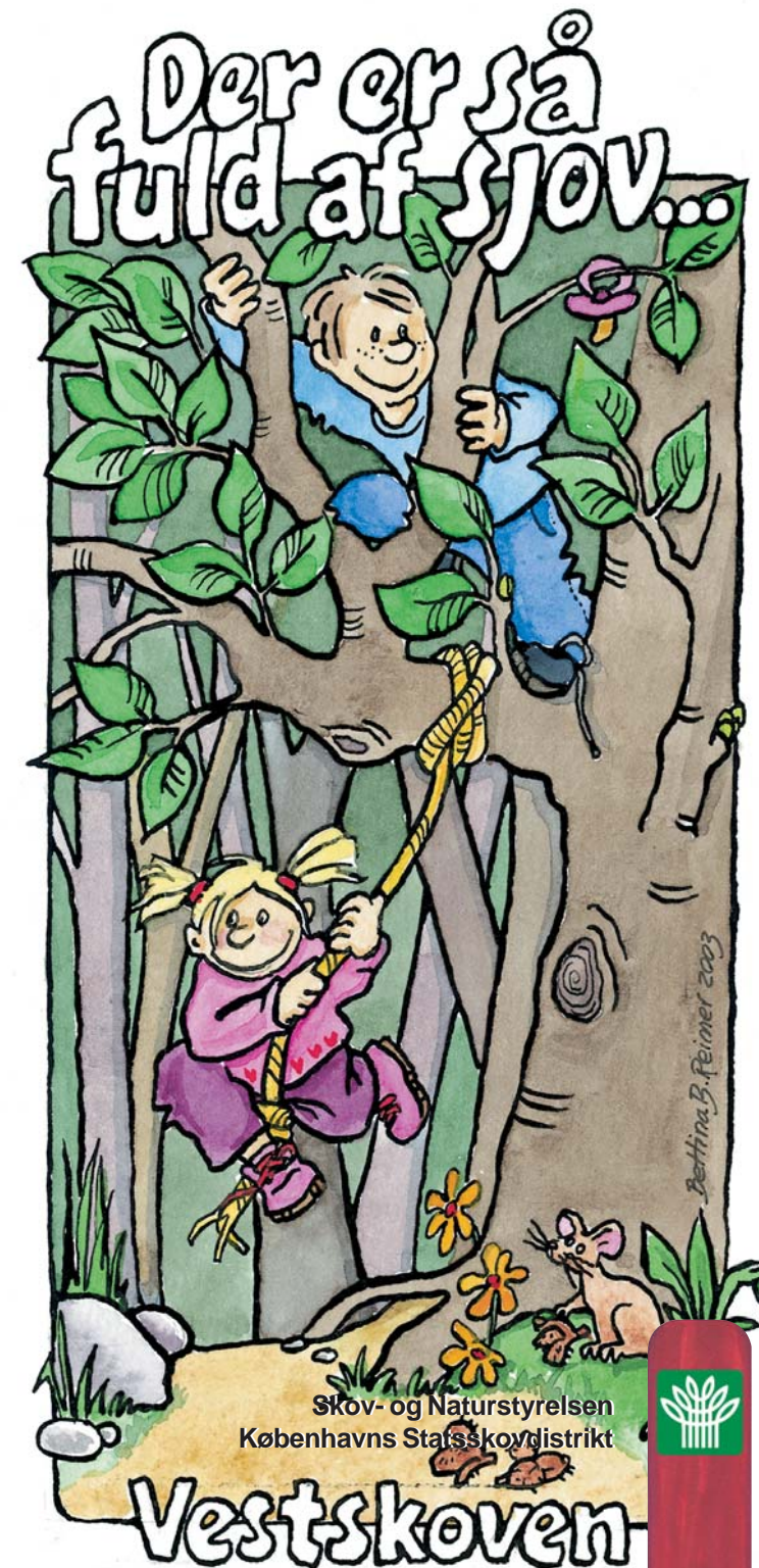
Illustration: Bettina Brønnum Reimer Kort: Parabole Aps Grafisk tilrettelæggelse: Page Leroy-Cruce Tryk: Frederiksberg Bogtrykkeri Oplag: 40.000 Udgivet: 2003