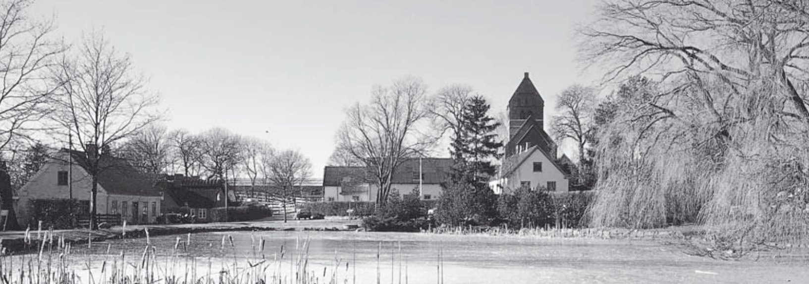
Vinter i Ledøje.