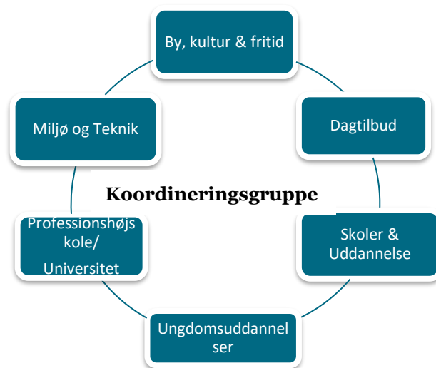
Figur 3 - Koordineringsgruppen

For at tilgodese en innovativ dialog inden for naturfag og naturfaglige miljøere, etableres en koordineringsgruppe (figur 3). Gruppen mødes løbende og består af repræsentanter, der understøtter fælles indsats og den fortsatte udvikling af den naturfaglige kultur i Albertslund Kommune. Tovholder er Skoler & Uddannelse. Med repræsentanter fra forvaltningen, skoler, kommunalt faglige netværk, ungdomsuddannelser, professionshøjskole/Universitet, skole – og virksomhedssamarbejde, koordinator for ASTRA.