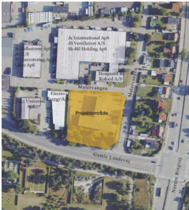
Figur 1. Projektområdets placering på Malervangen 1

Bebyggelsen vil indeholde ca. 106 lejligheder med en gennemsnitlig størrelse på ca. 87 m 2 . Projektets placering ses i figur 1. Projektområdet er en del af byomdannelsesområdet i Hersted Industripark og omfattet af Lokalplan 5.11, vedtaget august 2024.