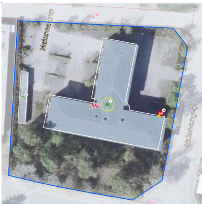
Figur 2. Eksisterende bygninger, der skal nedrives, Malervangen 1

Det eksisterende bebyggede areal er 989 m 2 og udgøres af en kontorbygning og udhus med fyringsanlæg med sløjfet nedgravet olietank. Se figur 2.