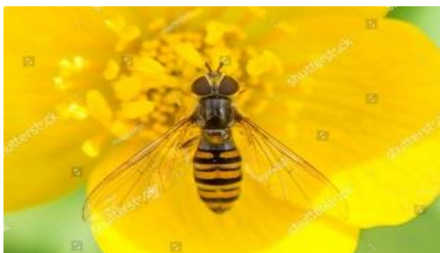
Blomsterflue, en vigtig bestøver, suger nektar fra blomst