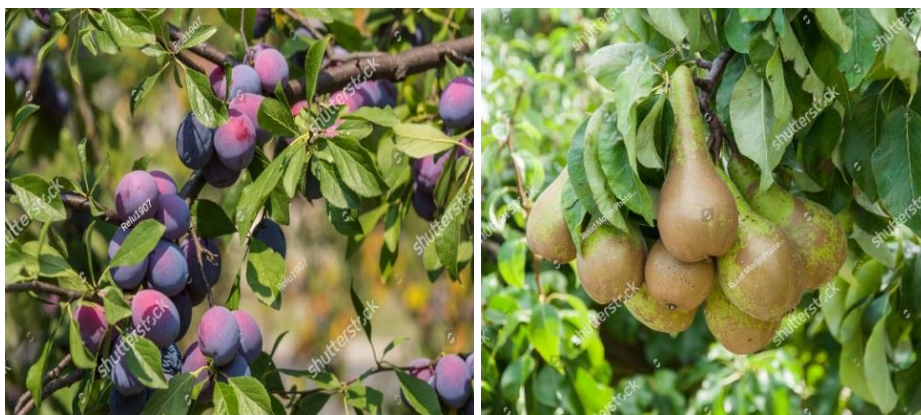
Venstre: Hanita-blommer. Højre: Conference-pærer