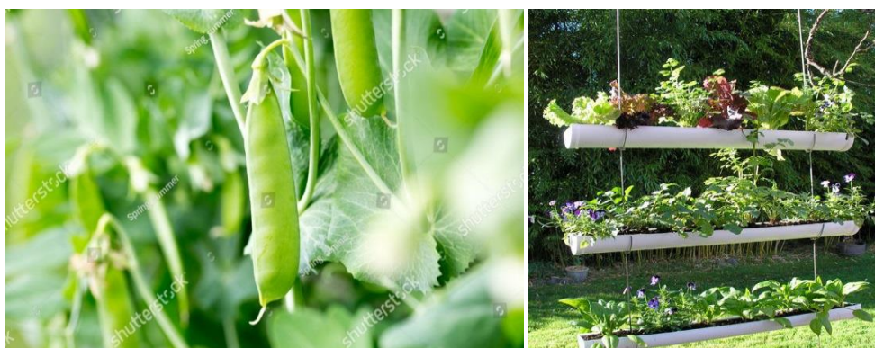
Venstre: sukkerærteplante. Højre: nedløbsrør brugt til hængende urtehøve