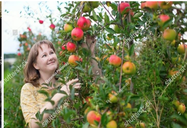
Venstre: salat i højbed. Højre: kvinde ved sine æbletræer