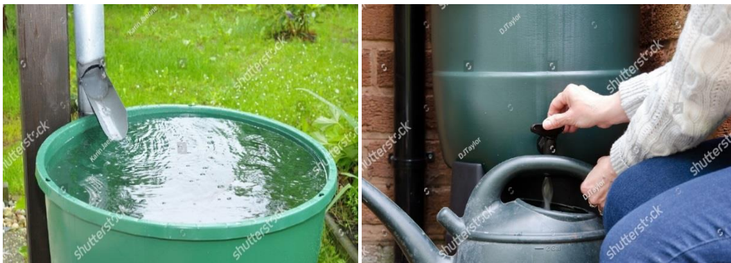
Venstre: nedløbsrør, der leder regnvand ned i beholder. Højre: regnvand tappes fra beholder

Har du først anlagt en have, vokser der sandsynligvis mange planter, og de er alle sammen tørstige. Vand skal der til, og det er ikke gratis. Det er regnvand til gengæld, og der findes masser af smarte løsninger til at opsamle regnvand, som efterfølgende kan bruges til dine planter. Mange regnvandsbeholdere kan påmonteres aftapningshane, slange, nedløbsventil, pumpe og andre ting, der gør håndteringen af vandet nemmere. Beholderne behøver bestemt ikke at være grimme og fås i mange farver. De er som regel i plast og derfor lette at bære rundt på, når de er tomme. Er du praktisk anlagt, kan du også bygge beholderen selv af f.eks. en gammel tønde eller andre beholdere, du kan få fat på, for størrelsen bestemmer du jo selv. Det er kun fantasien, der sætter grænser, men bygger man den selv, er man nødt til at sikre sig, at beholderen ikke lækker giftige stoffer ud i vandet (brug f.eks. ikke trykimpregneret træ). Regnvandsbeholdere er også prisvenlige, da en beholder til ca. 200 liter vand kan fås for 100-150 kr. Er beholderen stor nok, kan du endda gøre den rigtigt dekorativ ved at plante en gul åkande eller hvid nøkkerose i den. Det vil dog også kræve, at du lægger en vandplantegødningkugle i jorden, da planten ellers ikke får næring. Næringsstofferne vil størstedels blive opbrugt af planten og kun meget lidt vil slippe ud i vandet. Blicher vandstanden for lav, må der suppleres op med vand fra hanaen, ellers går planten ud.