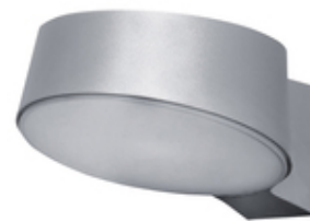
NYX 190 - Focus Lighting