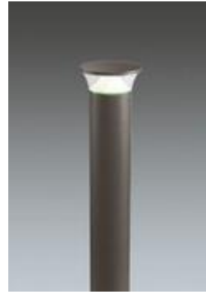
Thorn Lighting - Thor Pullert