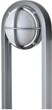
Louis Poulsen - Skot Pullert