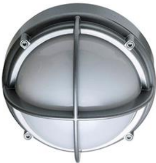
Skot lampen - Louis Poulsen