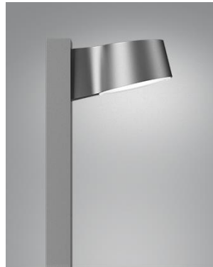
NYX Pullert - Focus Lighting