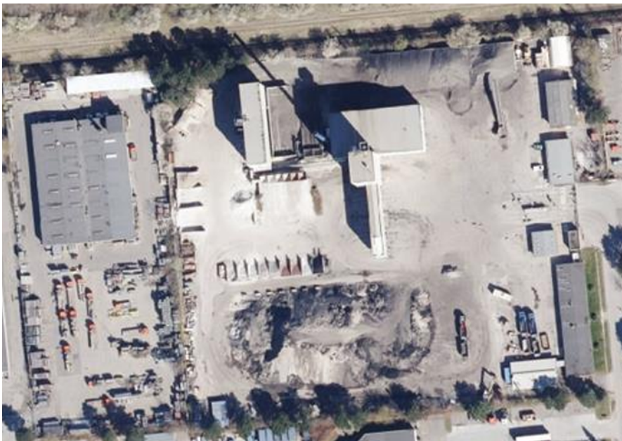
Figur 1. Luftfoto af Colas Asfaltfabrik, Fabriksparken 34-36

Selve asfaltværket er ikke ændret, men oplaget af opfræset asfalt til knusning samt GMA-oplaget er steget gennem årene. Vilkåret fra 1995 er på 2.000 ton, og behovet i dag for oplagring er op imod ca. 50.000 ton, fordelt på opfræset asfalt og på GMA. Figur 1 og 2 viser oversigt over Colas Asfaltfabrik.