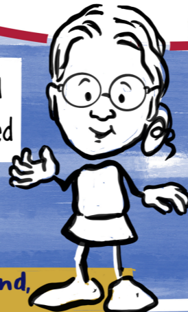
Line Højland, Ventilen.

2013: 5% unge oplever ensomhed 2023: 17% unge oplever ensomhed