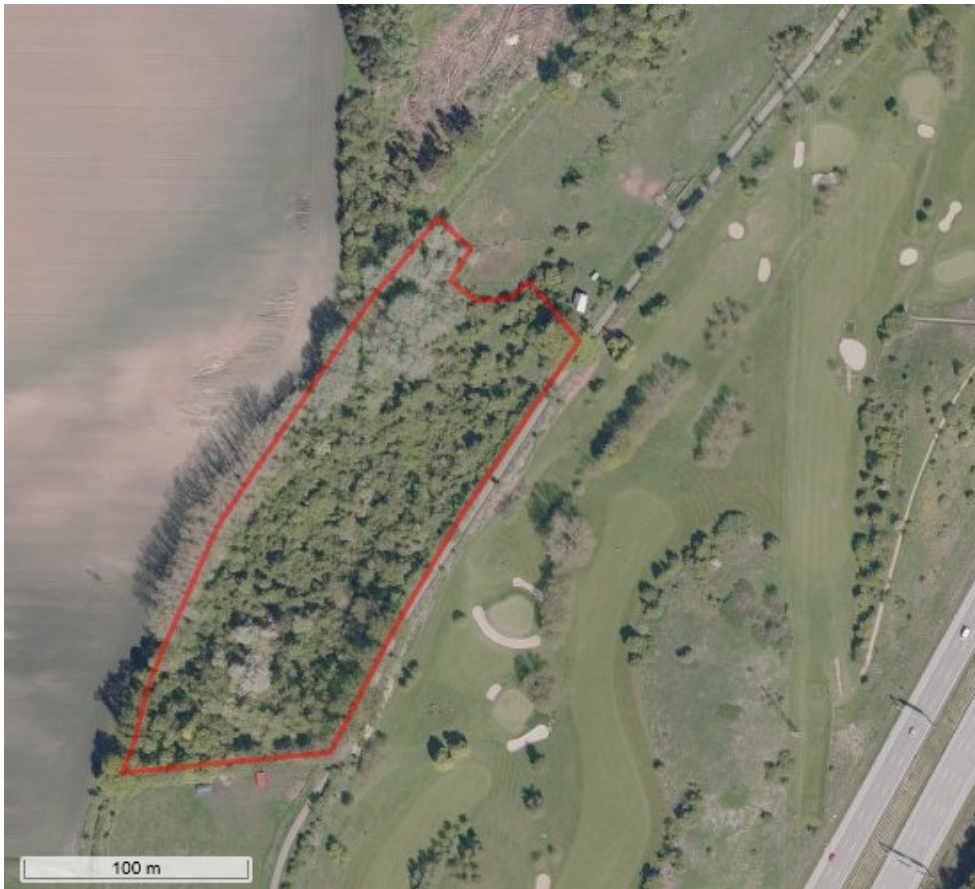
Luftfotoet fra 2018 viser arealet og den nuværende udstrækning af bevoksningen.