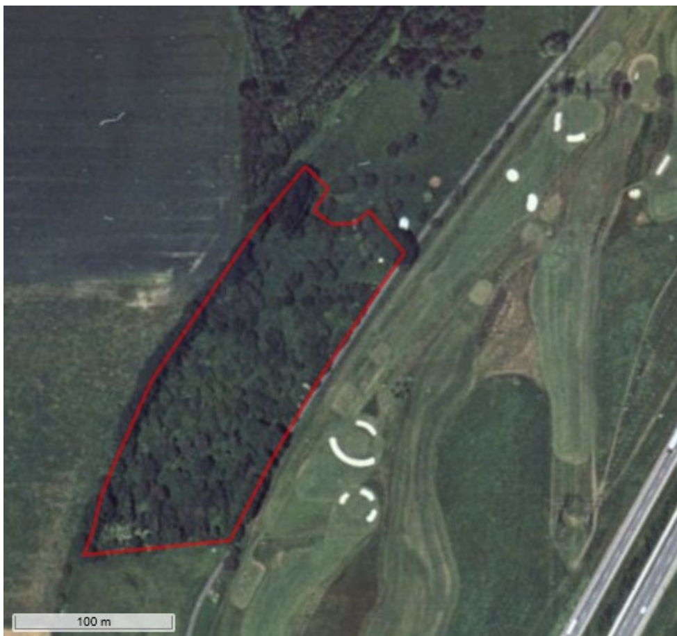
Luftfotoet fra 1995 viser arealet og den daværende udstrækning af bevoksningen.