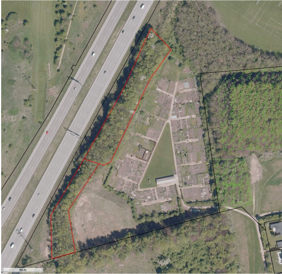
Luftfotoet fra 2018 viser den del af bevoksningen der ikke er lokalplanlagt.