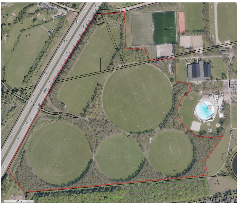
Luftfotoet fra 2018 viser den del af arealet, der er omfattet af Lokalplan nr. 9.2 Albertslund Stadion – Baneanlæg fra 1980.