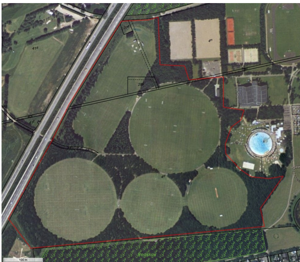
Luftfotoet fra 1995 viser den del af arealet, der er omfattet af Lokalplan nr. 9.2 Albertslund Stadion – Baneanlæg fra 1980.