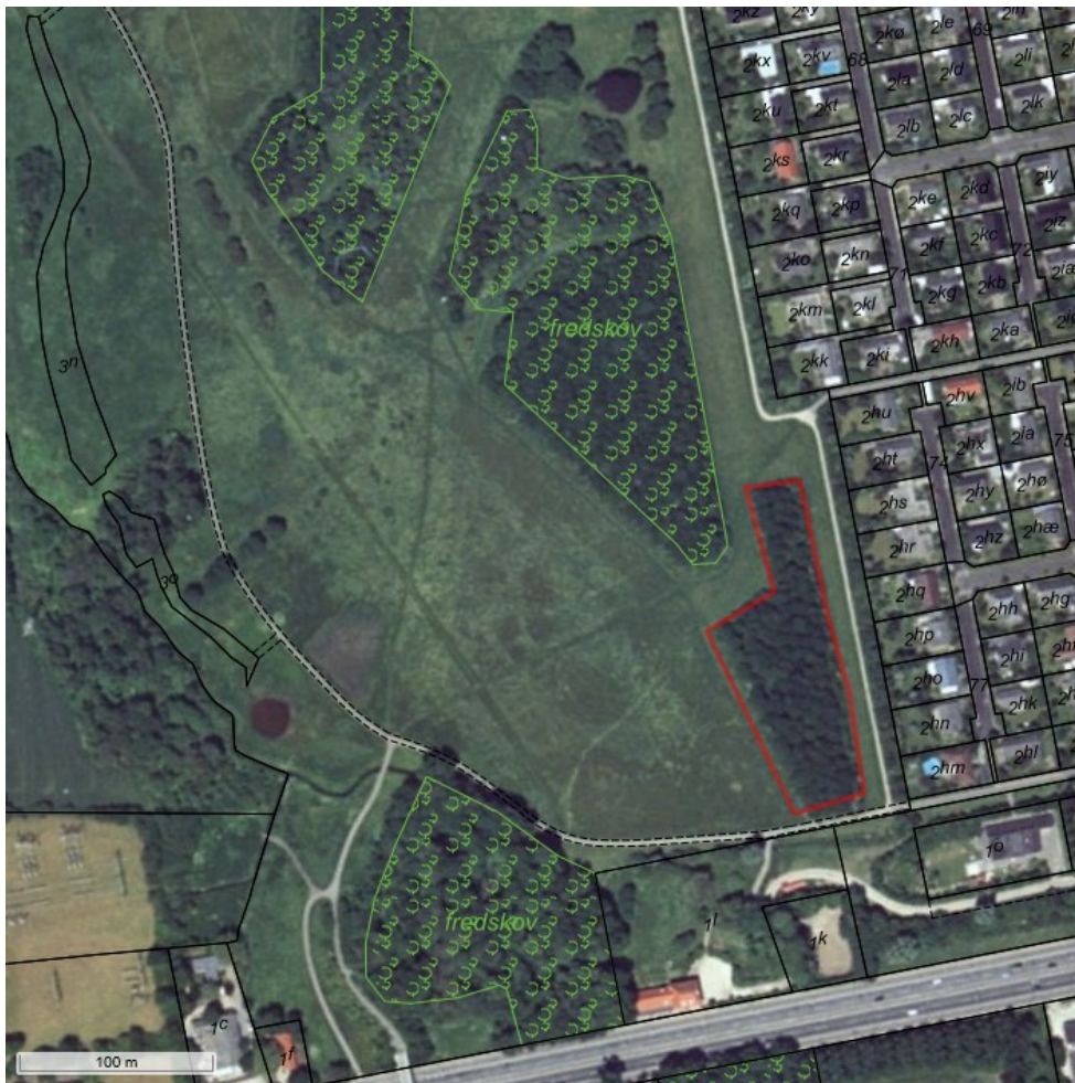
Luftfotoet fra 1995 viser arealet og den daværende udstrækning af bevoksningen.