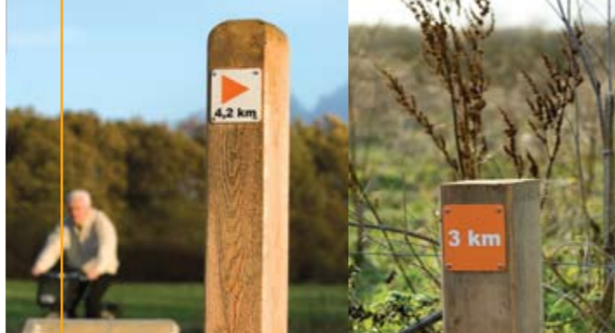
Ruterne er mærket med pæle forsynet med pilemærker i 6 farver. Lave pæle med km-mærker viser hvor langt du har løbet.

Stisystemet i Albertslund Kommune er egentlig anlagt til fodgængere og cyklister, men det er oplagt også at bruge det til løbetræning. Ni afmærkede løberuter på tilsammen 52 km går gennem kommunens grønne områder og en oplyst vinterrute gennem byområdet.