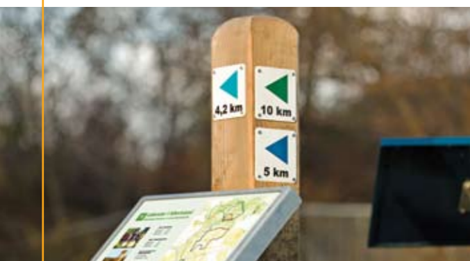
Startpunkter er udstyret med et kort der viser alle ruter.

Vinterruten – ved indgangen til Stadionhallerne