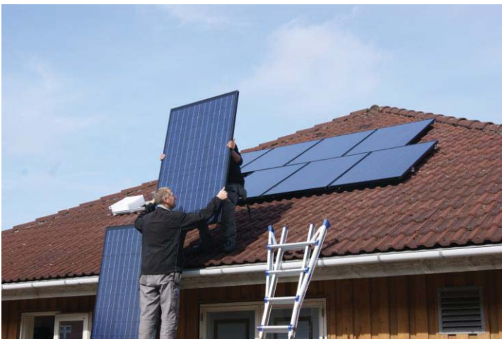
Solcellerne i Solhusene monteres

Endnu mere perspektivrigt er det samarbejde, vi har indledt med BO-VEST og DONG om, at udvikle et koncept for hvordan lejerne i de almene boliger kan få opsat solceller via råderetten . Ideen er, at boligafdelingerne sørger for opsætningen og betalingen af solcellerne. Til gengæld vil lejeren få en huslejestigning. Men huslejestigningen skal være mindre, end den besparelse lejeren får på sin elregning! I 2012 forventer vi at kunne gennemføre den første fuld-skala-test af konceptet. Samtidig håber vi på, at kunne afprøve et koncept for et stort solcelleanlæg til dækning af afdelingens fælles el-forbrug i Kanalens Kvarter. Lykkes det at realisere koncepterne for ”Råderets-solceller” og ”Fælles-solceller” – og det tyder alt på, at det gør – så vil det kunne bruges i de fleste af landets 550.000 almene boliger.