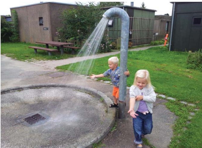
Vand er også sjov

I VA 4 Syd, Den Tyrkiske Kulturforening og på Vestegnens Sprogskole har vi holdt oplæg. Og på Grøn Dag på materialegården, "Grønne Fodspor" i A-centeret, Markedsdagen i Syd, Sommerfesten i Nord og i Blokland havde vi en vandsparebod.