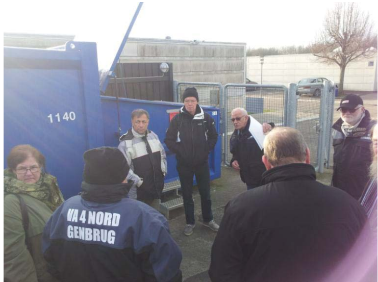
Affaldsgrupper i SYD på inspirationsbesøg på genbrugsgården i VA 4 Nord

Derfor vil vi i 2012 bl.a. hjælpe boligområder med design og opgradering af deres genbrugsgårde, tage initiativ til mere direkte genbrug, formidle gode erfaringer boligområderne imellem, lave en kampagne for miljøcertificeret træ, arbejde med madspild og doggy-bag, kontakte pizzeriaer der ikke respekterer ”Ingen reklamer – Tak!”, arrangere kompostkursus og gøre en indsats mod affaldssvineriet i Kongsholmparken.