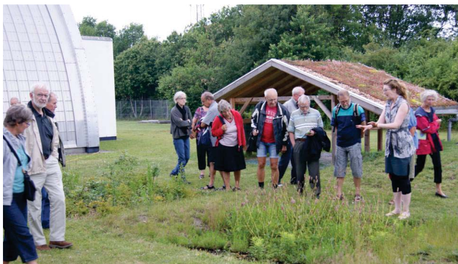
Fra inspirationsturen til regnhaven på Avedøre Holme

LAR – Lokal Anvendelse af Regnvand. Men vandproblematikken omfatter mere end forbruget. Et stadig vigtigere aspekt er håndteringen af de stadig stigende regnmængder, som vi oplever i takt med de menneskeskabte klimaforandringer. En stor udfordring er at tilbageholde regnvandet i stedet for at lede det til kloakkerne, der ikke er designet til så voldsomme mængder vand. En måde at undgå oversvømmelser på er at anvende vandet på egen grund. Det handler om at lave gennemtrængelige belægninger, grønne tage, opsamling i regnvandstønder, etablering af regnbede i haven og faskiner til nedsivning. Derfor udarbejdede vi i samarbejde med Albertslund Vand og Spildevand ApS folderen ”Regnvand i haven – håndter det selv og få penge tilbage!”. Det sidste hentyder til, at vandforsyningen refunderer op til 40 % af tilslutningsgebyret, svarende til ca. kr. 20.000, hvis man håndterer sit regnvand selv. I samarbejde med grundejerforeningerne blev folderen uddelt i alle ejerboligområder, der samtidig blev inviteret til to møder om LAR og en inspirationstur til Spildevandscenterets nyanlagte regnhave på Avedøre Holme.