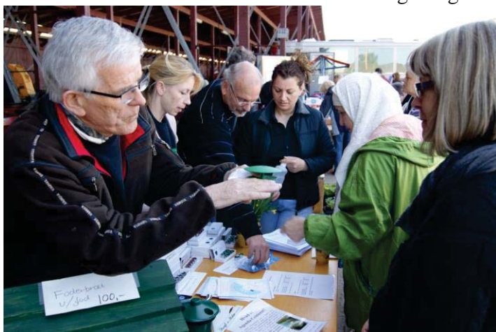
Trængsel ved boden på Grøn Dag

som forvaltningen enten selv ville være nødt til at udføre eller engagere en konsulent til. For os betyder de nye spændende opgaver, et bredere netværk ind i forvaltningen og en indtægt, der gør, at vi kan opretholde tre faste stillinger. For kommunen betyder det, at de billigt og effektivt får løst nogle specielle opgaver af folk med lokalt kendskab og engagement.