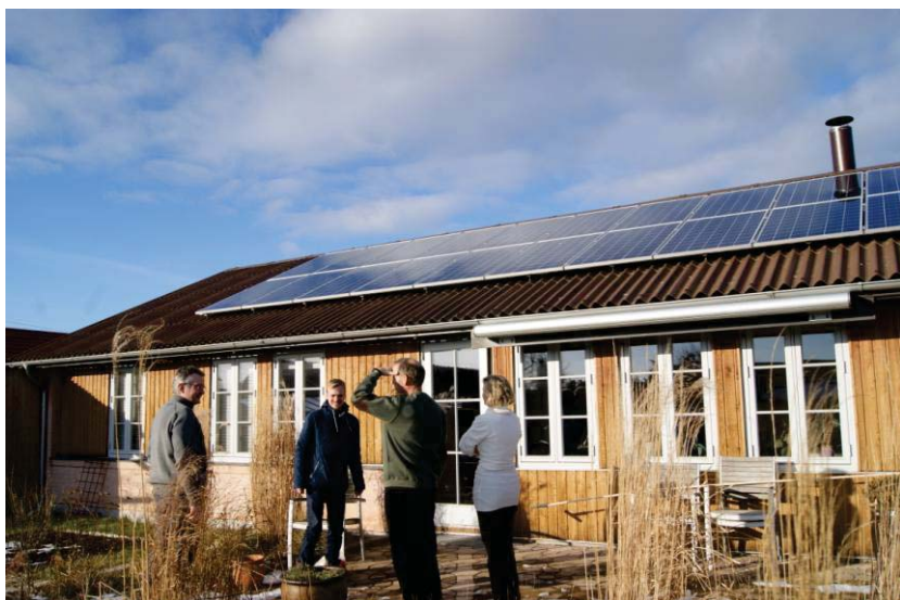
Solceller opsat i Platanhaven i juli 2011