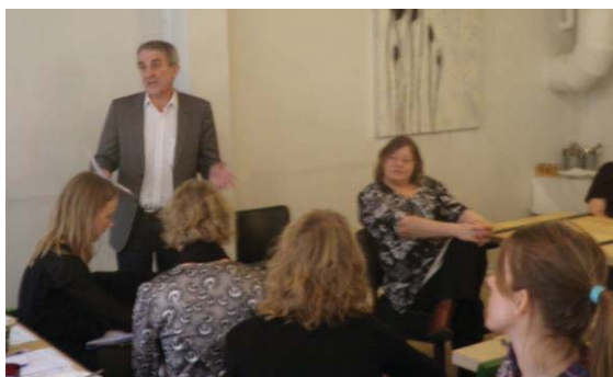
Steen Gade og Mette Gjerskov til Årsmøde

Netværket for Lokale Agenda 21 Centre. ACA er sekretariat for Netværket for Lokale Agenda 21 Centre. Til Netværkets årsmøde inviterede vi to af Folketingets miljøordførere, Mette Gjerskov og Steen Gade, for at få deres vurdering af miljøsituationen. Politikkerne udfordrede os,