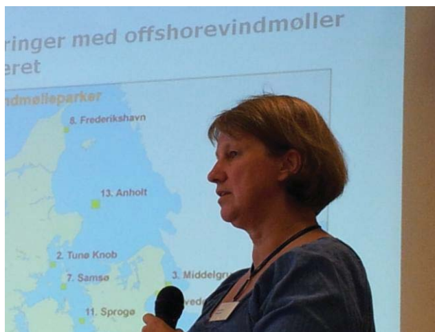
Fra vindmøllekonferencen i september

Om der er plads til en stor vindmølle eller to i Albertslund , har vi fortsat ikke fået afklaret, men vi arbejder på det, såvel som vi sammen med Agenda Centrene i Taastrup og Køge, samlede 50 repræsentanter fra kommuner og erhvervsliv omkring Køge Bugt, til en konference om vindmøller – hvad enten de så skal stå på land, kystnært eller til havs. Konferencen blev fulgt op med et ”arbejdsseminar” med 25 deltagere, og processen fortsætter ind i 2012.