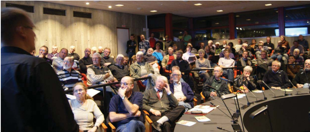
Der var mere end fuldt hus til solcelle mødet den 22.11. i kommunalbestyrelsessalen

ekskursioner, vi påtænker at lave. Som opfølgning på mødet har vi også udviklet en solcellemenu på vores hjemmeside, som beskriver, hvad man har brug for at vide og overveje, hvis man som privatperson vil opsætte solceller på sit hus.