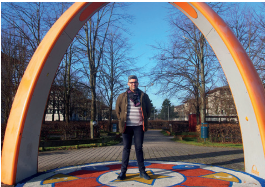
Asam er klar i Hedemarken.

Projektet søger fritidsjob til unge under 18. Så hvis din virksomhed har opgaver, som det kniber med at nå i hverdagen, kan I hyre en ung i fritidsjob til at klare det på ungarbejderløn. Samtidig bliver den unge præsenteret for jeres branche og fag. Der søges også job til de helt unge mellem 13 og 15 år. Unge under 15 år må kun arbejde 2 timer på skoledage og 7 timer i weekenden.