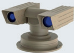
Laserløsning til overvågning - et Scion DTU-projekt

Igennem projektet kan virksomheden få assistance til at udvikle fx et højteknologisk koncept eller en prototype i tæt samarbejde med forskere fra DTU.