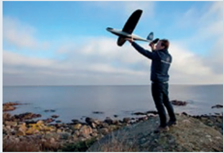
Dansk firmas droner kan nu se med centimeters nøjagtighed - et Scion DTU - projekt

Forløbet understøttes løbende af innovationskonsulenter samt af forretningsrådgivere, der kan hjælpe virksomhederne til at opnå kommerciel succes.