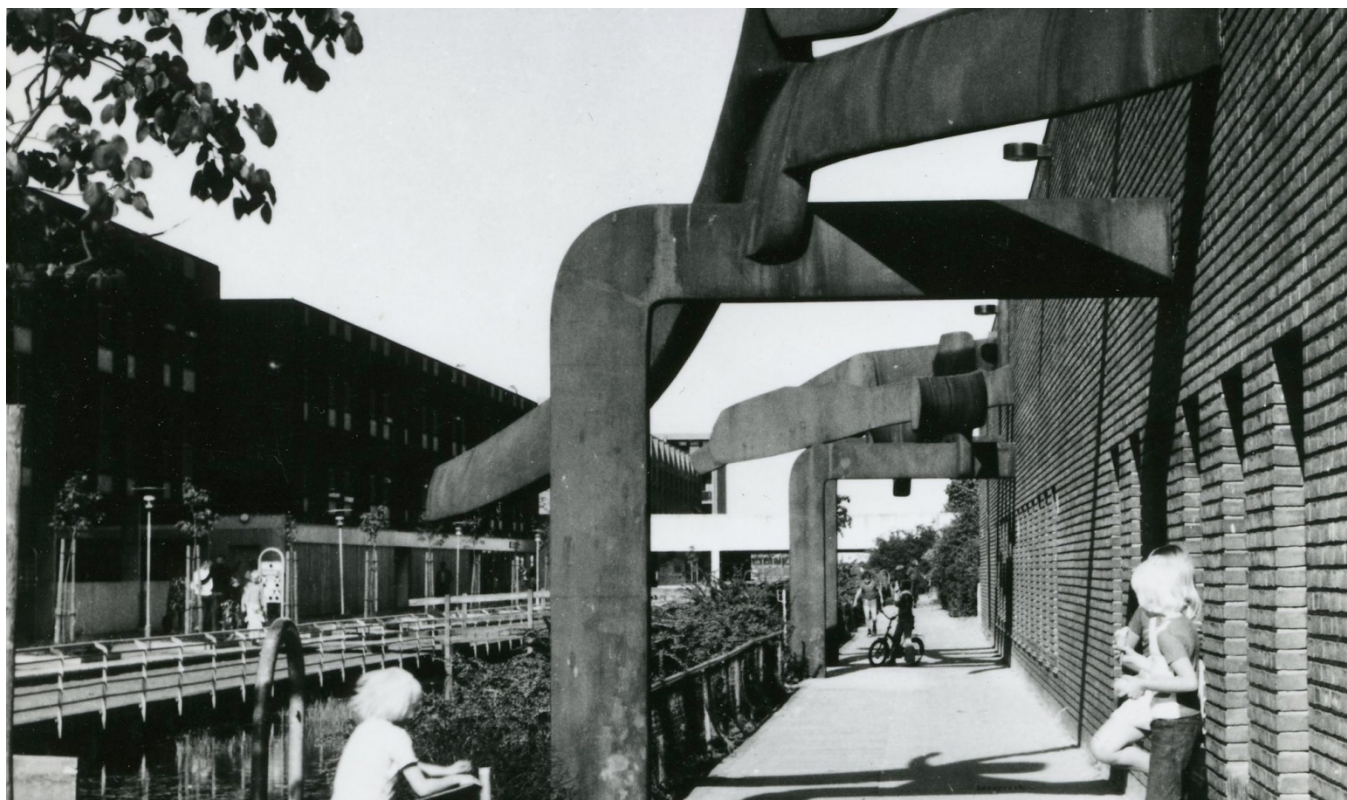
Den store stedsspecifikke "Skulptur i 2 dele" (1977) af Willy Ørskov er et af kunstnerens hovedværker og vil i 2016 stå som ny efter en omfattende renovering.

Den digitale kunst kan dermed ændre byrummets rolle, præsentere andre virkeligheder eller give bud på alternativer til livet hjemme foran computer, smart phone og