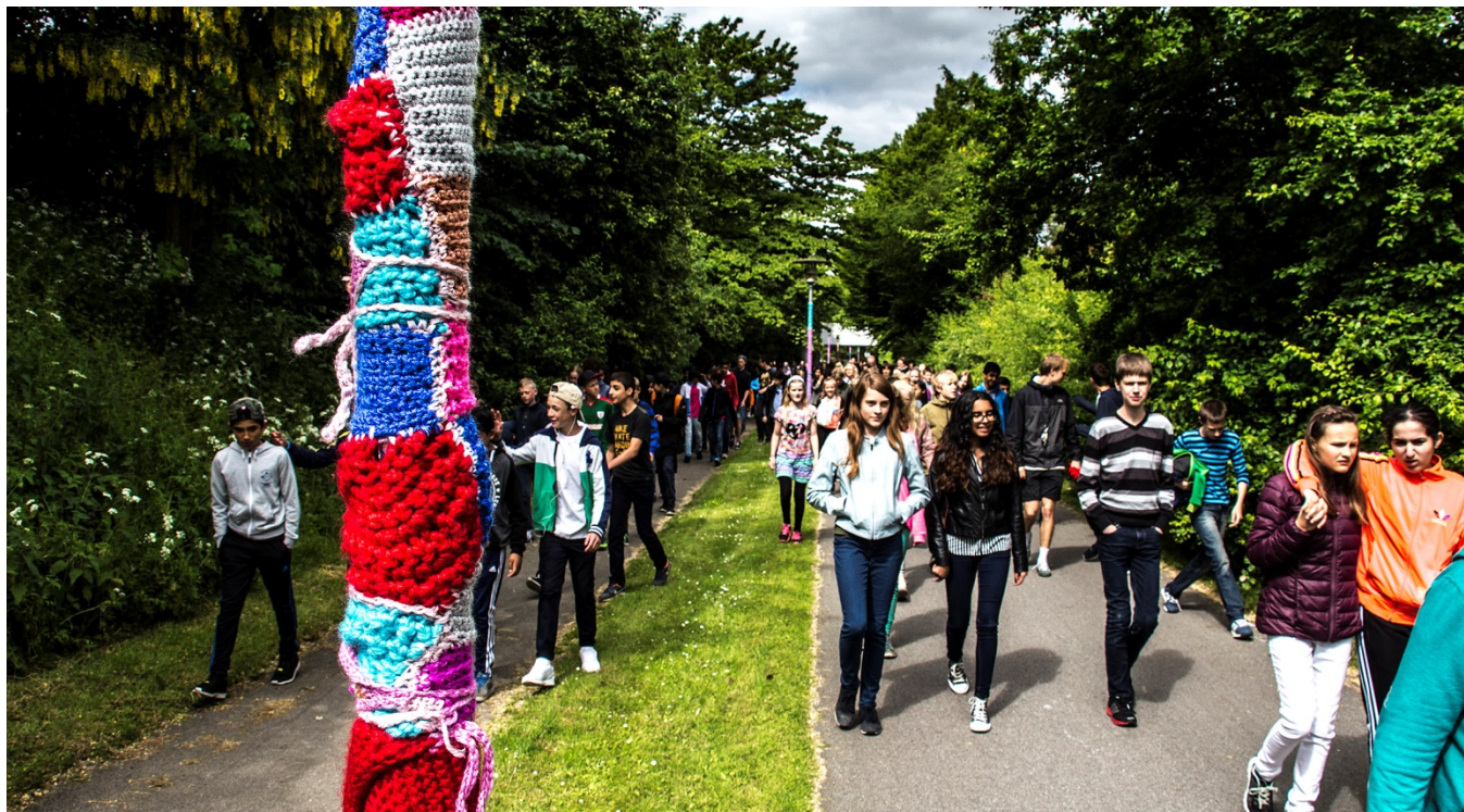
Elevrådet besluttede i 2015 at udsmykke lygtepæle på Trippendalstien med strik. Et fint eksempel på et tidsbegrænset projekt.

smukt og appellerende, at det er svært at slippe, eller af at det provokerer, ”kommer på tværs” og skaber ”forstyrrelser” i hverdagen. Om man kan lide værkerne eller ej, medfører kunst i det offentlige rum debat, der vidner om medborgerskab og demokrati.