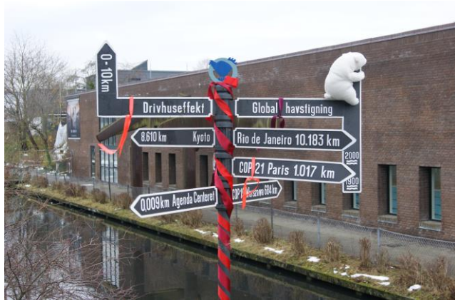
Klimaskiltet pyntet op til Topmøde

Alverdens lande blev enige om en global klimaafnate på Klimatopmødet i Paris i december. En aftale, der ikke bare taler om, at temperaturen maks. må stige 2 grader, men en aftale, der har strammet op, og nu taler om, at temperaturen helst ikke må stige mere end 1,5 grad. I dag har vi allerede passeret den første grad, så det er en kæmpe udfordring, verden står over for. Klimaafnaten gør det da heller ikke alene. Den er ikke forpligtigende og vidtgående nok, når det kommer til handling og sanktionsmuligheder. Det er ikke klimaafnaten, der kommer til at "redde verden". Det er fortsat afgørende, at der handles lokalt. Men trods alt er klimaafnaten en fælles platform, som alle lande nu har stillet sig på, og som sådan er den et stort skridt fremad og et godt udgangspunkt for det fortsatte arbejde - også lokalt for erhvervsliv, kommuner og borgere. For Albertslund er Klimaafnaten inspiration til at fortsætte med den fysiske energioptimering af byens boliger, med udvikling af energieffektiv belysning, med opsætning af solceller, med omstilling til lavtemperatur fjernvarme og med at spare på både el og varme. Robuste samfund beror ikke på fossile brændsler. Klimaafnaten kan sætte skub i omstillingen hen imod mere robuste Vedvarende energisamfund. Men bolden skal gribes, for det sker ikke af sig selv - aftale eller ej.