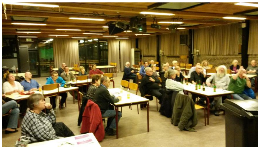
Fra en af mange generalforsamlinger om ny affaldsordning

Vores mål er, at der skal foregå Agendaarbejde i samtlige boligområder i perioden 2011-15, og at forbrugene falder. At udvikle netværk, samarbejder og engagement. At lave demonstrationsprojekter og informere. At fremme den nationale omstillingsproces i samarbejde med andre lokale Agenda Centre.