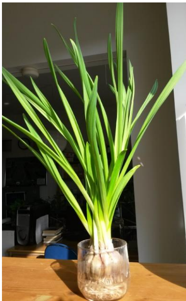
Urban farming på Agenda Centeret

I årets løb har vi uden held søgt penge til to projekter i ”Ildsjælepuljen”. For kommunen har vi, også uden held, lavet en ansøgning til kommunepuljen om affaldssortering og indvandrere. Vi var deltager i en stor DTU-ansøgning om energiforbruget i de nyrenoverede rækkehuse. Desværre gav den heller ikke pote. Til gengæld var vi udførende konsulenter på affaldsprojektet i Hedemarken og på nedgravede affaldsbeholdere i parcelhusområder.