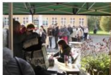
Hæftet er et inspirationskatalog. Det beskriver nogle af de mange dele-, bytte- og lånsordninger, der findes i Albertslund.

Radonmåler. Vores 3 radonmålere er konstant udlånt i vinterhalvåret, hvor radonniveauet er højest, fordi døre og vinduer ikke står åbne. Man låner en måler i 14 dage. Det kan give en fornemmelse af, om der er et radonproblem i boligen. Generelt er Albertslund ikke disponeret for radon, så for det meste skaber målerne bare vished for, at der ikke er noget problem.