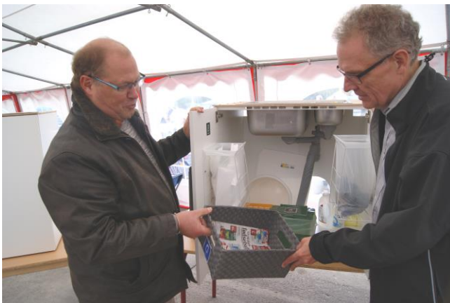
Borgmester og udvalgsformand tjekker vores indendørs sorteringssystem på Grøn Dag

Indendørs sortering. Et vilkår, for at de nye udendørs affaldsordninger kommer til at fungere, er, at folk kan overskue sorteringen indendørs – og at skulle gøre plads til 7 fraktioner i køkkenet, kan umiddelbart virke ganske uoverskueligt.