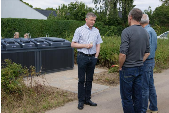
De nye beholdere indvies i Snebærhaven

Projekt ”Nedgravede beholdere i parcelhusområder”. For penge fra den såkaldte kommunepulje i Miljøstyrelsen, har vi kunnet lave Udviklings- og demonstrationsprojekter med nedgravede beholdere i ejerboligområder. Først fik de en nedgravet beholder til Pap i Herstedøster. Siden fik Snebærhaven nedgravede beholdere til både pap, glas, papir, metal og plast. I begge boligområder lavede vi sorteringsvejledninger og stemte dørklokker med spørgeskemaundersøgelse både før og efter. I Rødager skulle de også have haft nedgravede