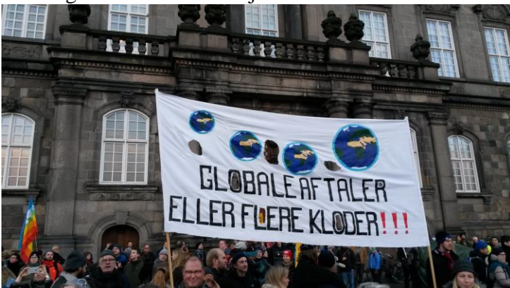
Vores klimabanner fra 2009 genbrugt til klimademonstration på Christiansborg slotsplads 2016

"Det er ikke klimaafnaten, der kommer til at "redde verden". Det er fortsat afgørende, at der handles lokalt"