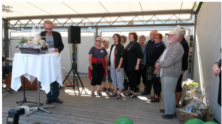
De frivillige i Drivhuset får kommunens Grønne pris

I 2015 blev de frivillige passere af Drivhuset hædret med kommunens Grønne pris.