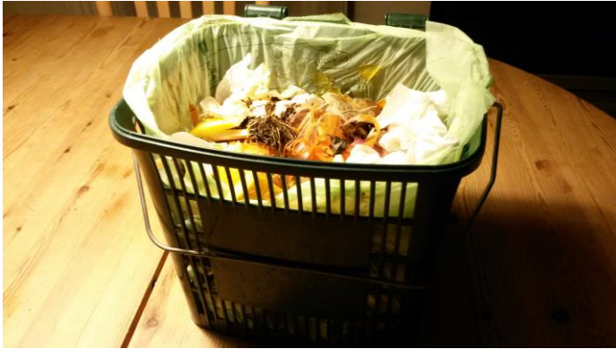
Biospanden alle albertslundere får

bruge til madaffaldet. Vi har også samlet erfaringer fra andre kommuner, der har indsamlet madaffald i årevis, og så er der jo rent faktisk også rigtig mange albertslundere, der i mange år har håndteret deres madaffald i egen kompostbeholder. Så det kan sagtens lade sig gøre, men det kræver lidt opmærksomhed. Således skal poserne være af en stærk kvalitet, beholderen i køkkenet skal være fyldt med huller, så posen ventileres, man skal slå en god knude på posen, og den skal ikke gå i stykker, når man lægger den ud i stativet eller beholderen udendørs.