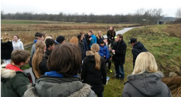
7. klasse undervises i Egelundparken

klasser i vandkredsløb og -besparelser, samt haft de samme klasser på en ekskursion ud i Egelundparken og Store Vejleådal for at se, hvordan vi håndterer regnvandet. I København har vi ligeledes undervist en 7. klasse på Copenhagen City school.