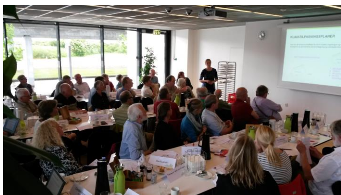
NGO'er mødes i HOFOR

I forbindelse med vores nye projekt ”Grønnere vaner” i Elmehusene, fik deltagerne spareperlatorer, og når de afprøver svanemærkede produkter, er der også fokus på, at det betyder færre kemikalier i vandmiljøet. Vi blev involveret i en sag, hvor driften i en boligafdeling havde brugt Round up, og vi har kvalitetssikret kommunens Grønne Regnskab.