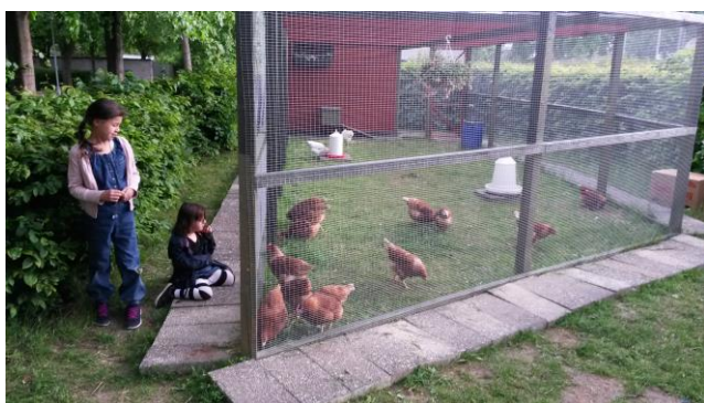
Den nye fælles hønsegård i Hedemarken

Vi bidrog i Naturfredningsforeningens nationale affaldsdag, arrangerede to Spis-Din-By cykelture og støttede biblioteket i Hedemarkens arrangement ”Albertslund deler frugten”. I Rækkehusene holdt vi oplæg om miljøvenlig beplantning, der både tager udgangspunkt i beboerne (det sociale), biodiversiteten (naturen) og driften (økonomien). Vi opsatte nudgingskilte på nogle af affaldsspandene i Kanalgaden, uddelte lommeskebægere til bl.a.