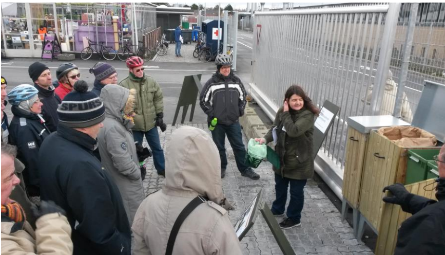
Instruktion i de nye affaldsordninger

Vores mål er, at Albertslund bliver en kredsløbsby, hvor både organiske og uorganiske materialer recirkuleres. At affaldssortering og genanvendelse bliver bedre. At vandkredsløbet sikres, så vi har en ren og rigelig grundvandsresurse. At næringsstofferne i regn- og spildevandet recirkuleres, og at vandforbruget falder til 90 liter/per/døgn.