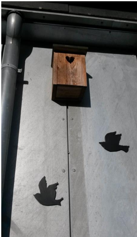
Figurer på vores facade

Albertslund Miljønetværk. Vores mailbaserede netværk af miljøinteresserede albertslundere havde vokseværk i 2015. I kraft af alle de nye kontakter vi fik i forbindelse med de nye affaldsordninger, kom mange nye deltagere til, så vi nu er omkring 300. Netværket bliver løbende holdt orienteret via mails og nyhedsbreve og bliver inviteret med til arrangementer og ekskursioner.