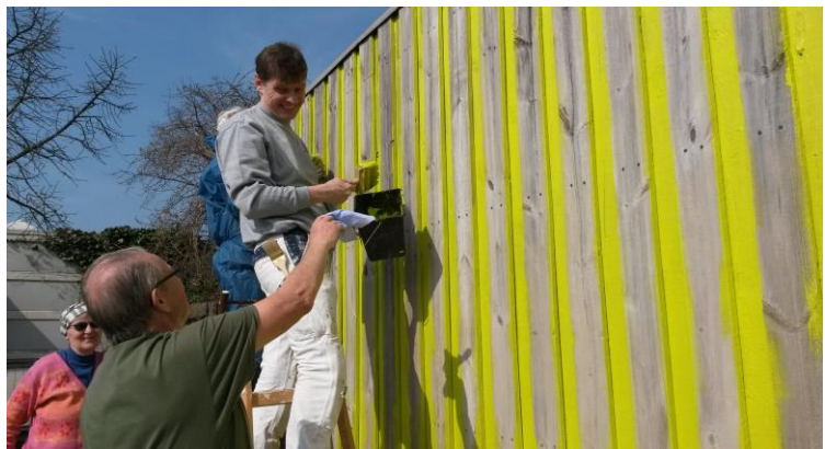
Huset i Faklens Kvarter fik farver

KØF rejste debatten ved at male og udsmykke huse. Først gårdhavehuset i Ørnens Kvarter (2014), så i 2015 et hus i Faklens Kvarter, et i Galgebakken og til sidst et i Røde Vejmølle Parken. Og arbejdet har ikke været helt uden imødekommenhed. Således besluttede kommunalbestyrelsen i den nye lokalplan for gårdhusene i Syd, at der skulle være visse muligheder for farver.