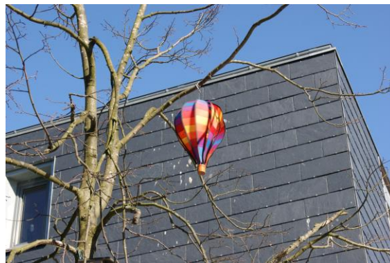
Vores luftballon i Kanalens Kvarter

Som noget nyt har vi samtidig ændret på måden at opgøre boligområderne. Vi har delt dem mere op, så f.eks. hele Damgårdsarealet med Gårdene, Buerne og Vængerne ikke længere tælles med som 6 områder, men nu som 18. Alt i alt når vi derfor op på ikke mindre end 81 boligområder!