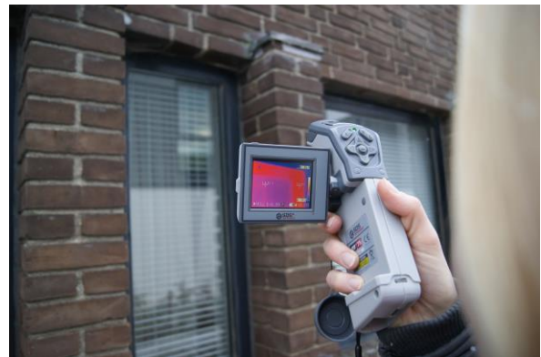
Termografikameraet viser kuldebroerne

Termografering. I 2015 besøgte vi flere end 30 boliger (først og fremmest parcelhuse) med vores varmfølsomme termografikamera. Termograferingen afslører hvor kuldebroerne er, og hvor der derfor først bør sættes ind, for at få et bedre indeklima og et lavere energiforbrug. Vores besøg er ofte første skridt på vej til handling. Vi kommer ikke med de byggetekniske løsninger på, hvad der nu bør gøres, men vi hjælper med at identificere problemerne, så husejeren bliver klogere og selv kan gå videre til en energikonsulent eller håndværker.