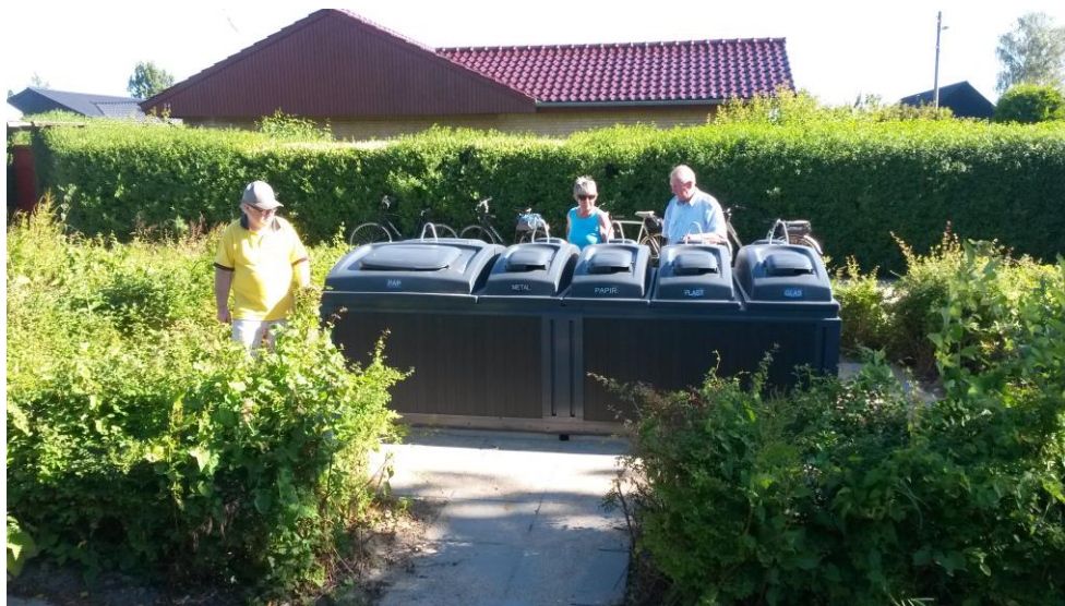
2/3 af beholderne er gravet ned i jorden

Nedgravede beholdere. Boligområderne kunne vælge mellem 6 forskellige affaldsordninger. I flere af dem indgik nedgravede beholdere, og næsten halvdelen af byens boligområder, valgte da også nedgravede beholdere. Men nedgravede beholdere er også gode. De har en stor volumen, uden at optage meget plads over jorden. De kan holde affaldet relativt køligt. De kan tømmes af en lastbil på meget kort tid. De er lette at holde rent omkring, og så er de en pæn løsning. Men som med alt mulig andet, kan der også med nedgravede beholdere opstå problemer – og i givet fald kan problemerne være meget