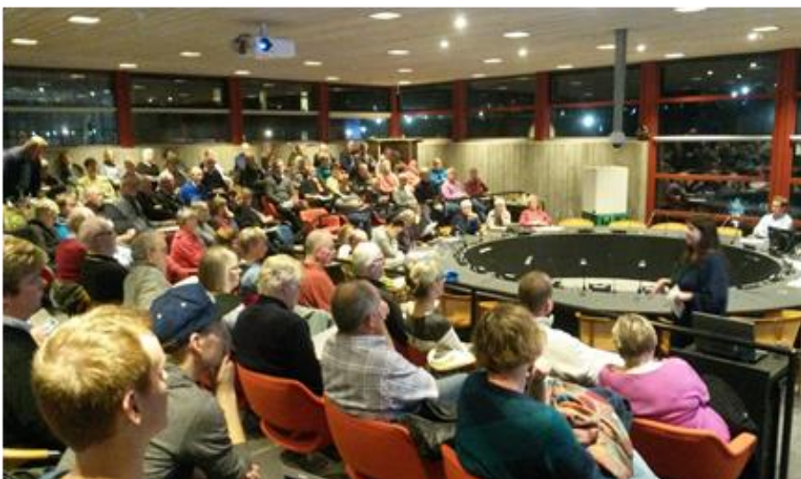
Affaldsstormøde i KB-salen den 17. nov.

I løbet af året arrangerede vi tre cykelture med de nye affaldsordninger som tema; herunder nedgravede beholdere. Og vi gennemførte to informationsmøder. Et i august med 25 deltagere i VA 4 Syds beboerhus, og et den 17. november med 110 deltagere i KB-salen.