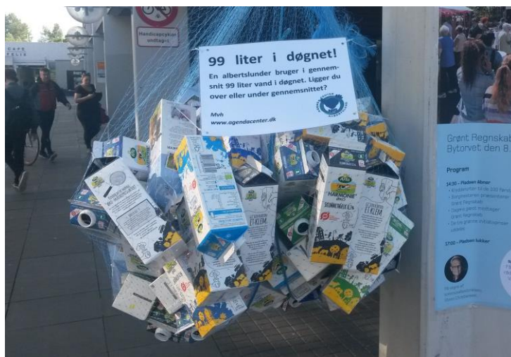
Som den første kommune er vi under 100 liter

På Egelundskolen har vi undervist tre 7.